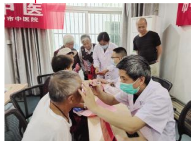
党员志愿者进社区