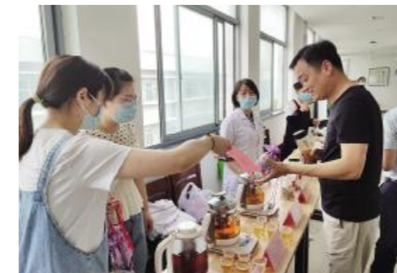
市委机关职工参与中药灯谜竞猜