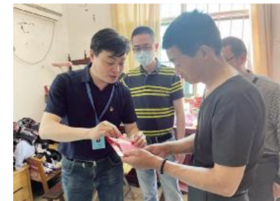
慰问“润苗工程”帮扶对象