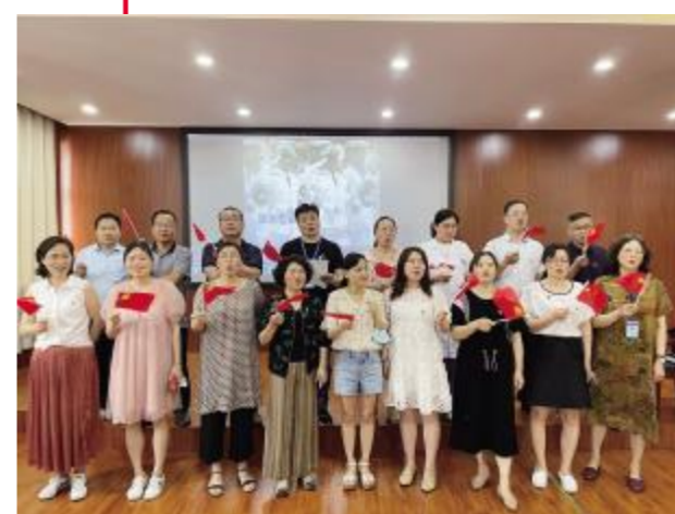
第一小组歌唱《团结就是力量》