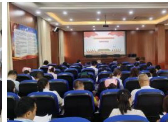
“明理、增信、崇德、力行”党史知识竞赛