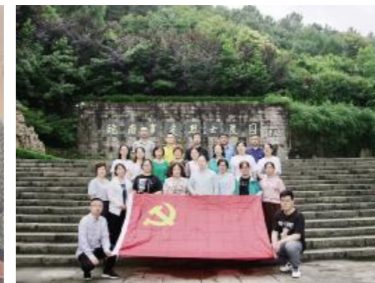
皖南事变纪念地合影