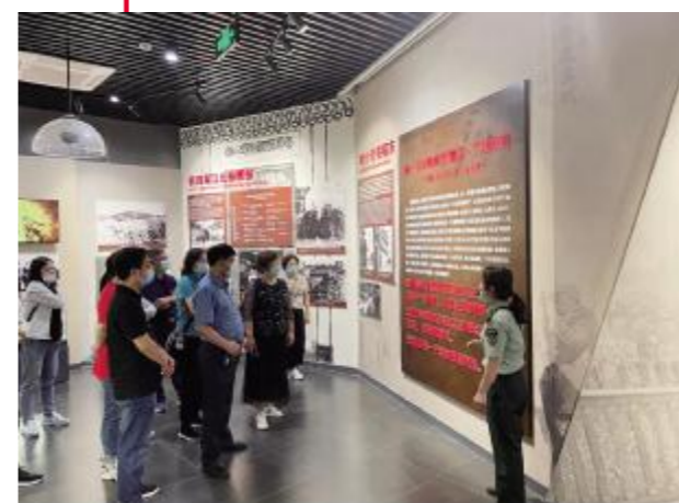
参观新四军军部旧址