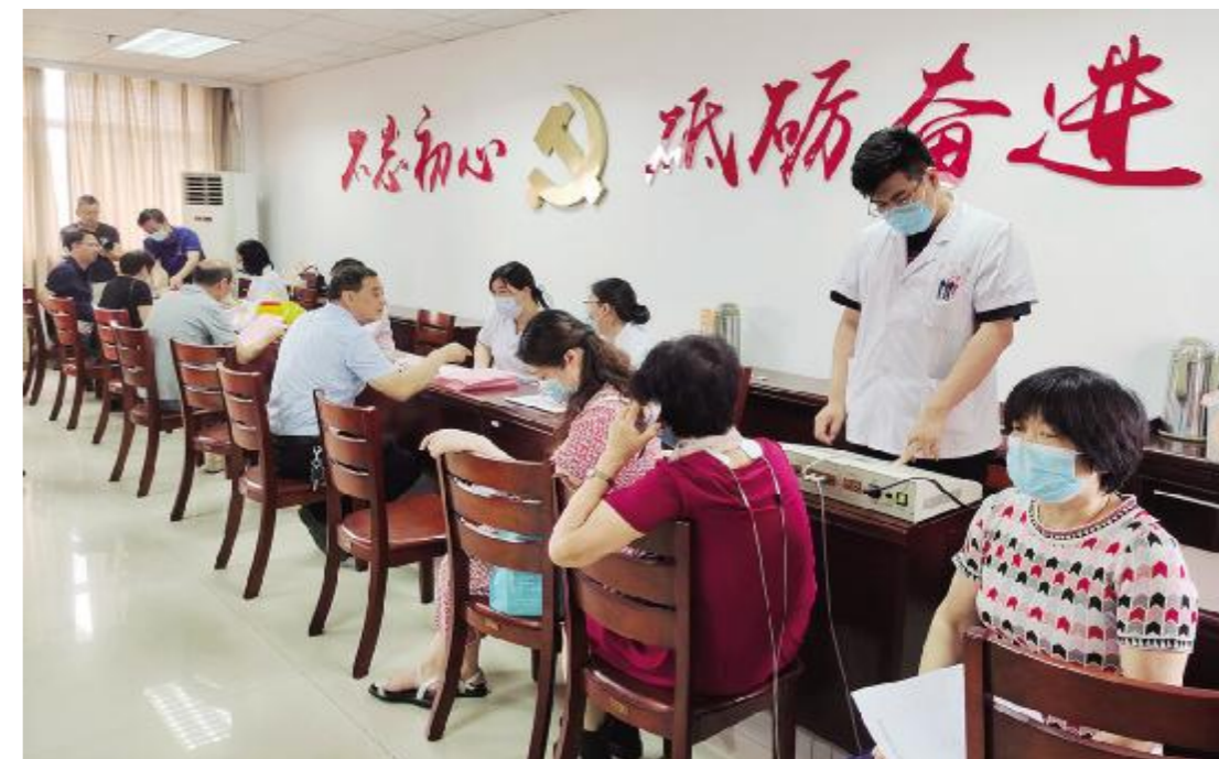
“中医大篷车”义诊进机关