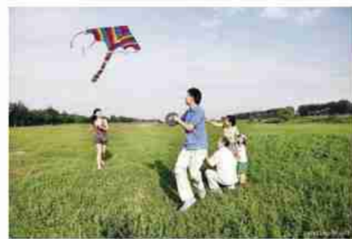
春季放风筝是集休闲、娱乐和锻炼为一体的养生方式。

踏青出游,一线在手,看风筝乘风高升,随风翻飞,实在是一件快事。风筝放飞时,人不停地跑动、牵线、控制,通过手、眼的配合和四肢的活动,可达到疏通经络、调和气血、强身健体的目的。看风筝高飞,眼睛一直盯着风筝远眺,眼肌得到调节,疲劳得以消除。这项活动特别适合青少年。中老年放风筝时要注意保护颈部,不要后仰时间太久,可仰视和平视相交替。放风筝最好在2~3人为宜,选择平坦、空旷的场地,不要选择湖泊、河边以及有高压电线的地方,以免发生意外。