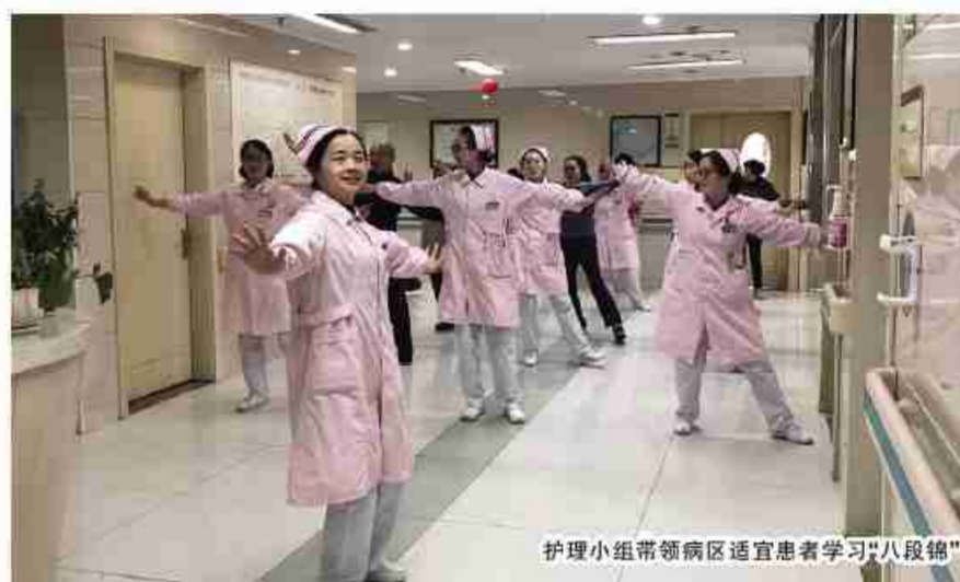
护理小组带领病区适宜患者学习“八段锦”

不仅是内科病区,儿科病区也有新动作。他们拟将床单元原有白色调更换为卡通图案,张贴可爱、童趣的温馨提示,设立儿童活动区域,添置各类玩具、病区增加绿色植物……通过系列举措使病区环境更为温馨,满足儿童生理和心理发展需求,改善患儿及家长就医体验。